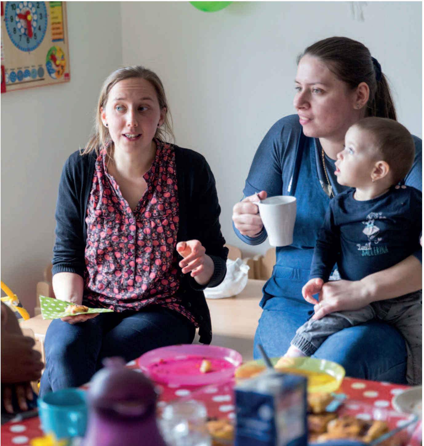
Um Eltern, deren Kind in einer Kindertagespflege betreut wird, den Unterschied zur Kita zu erläutern, hat sich eine Informationsveranstaltung bewährt.

pflege und Kita auf. Es werden Themen benannt wie Hol- und Bringzeiten, Frühstück, Mittagessen, Schließungszeiten, Freizeit- und Beratungsangebote eines Familienzentrums, Platzvergabe und Vertragsabschluss.