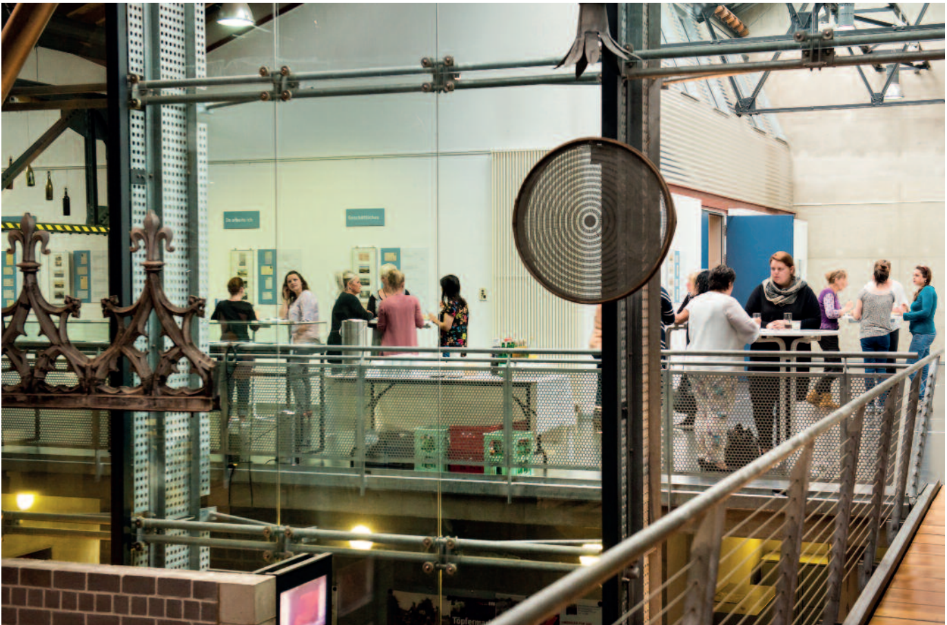
Regel Austausch auch in den Pausen beim Auftakt-Workshop zum Projekt