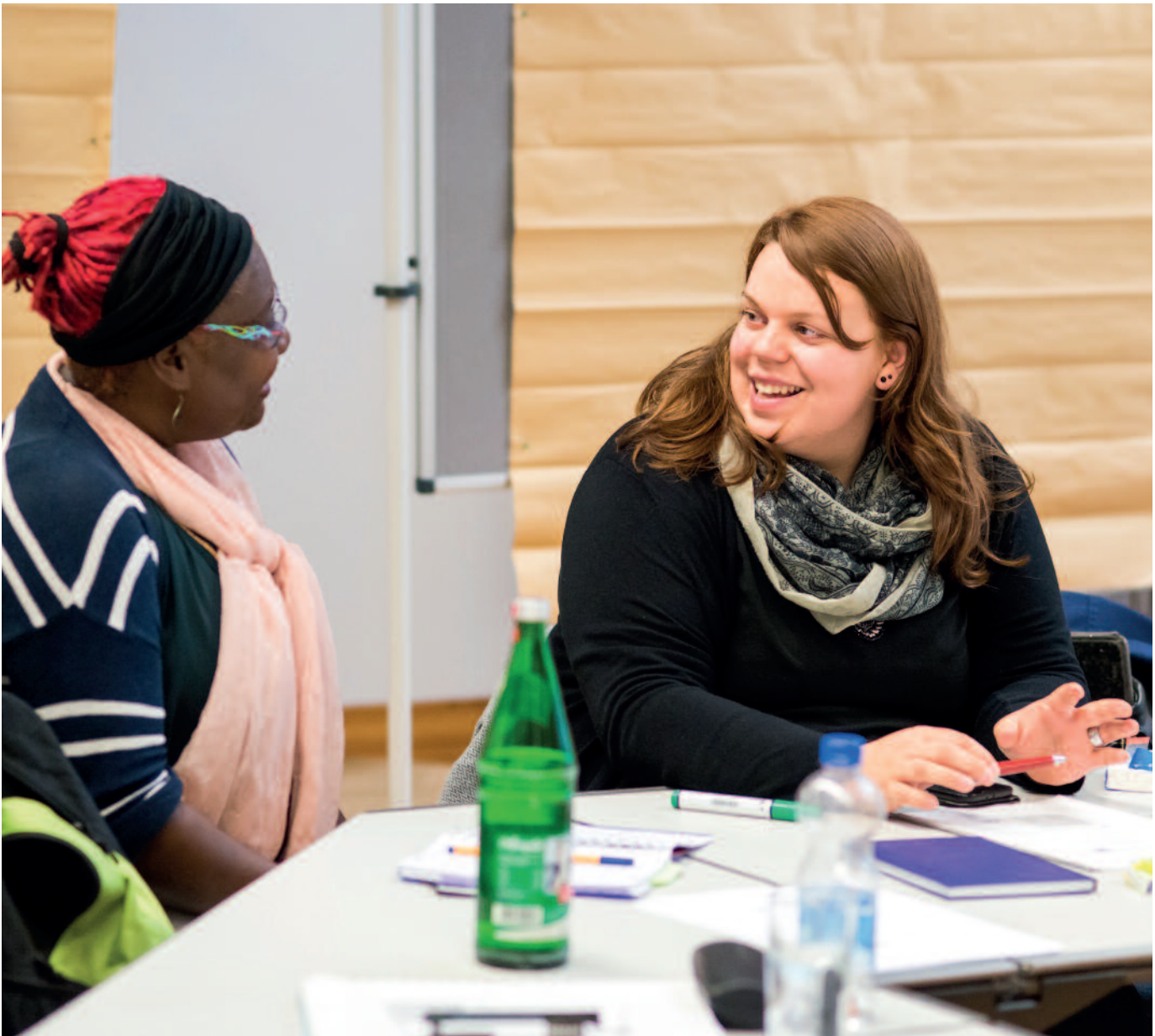
Gemeinsamer Workshop der Kita-Fachkräfte und Kindertagespflegepersonen

sicherlich eine reichhaltige Themenpalette dar.