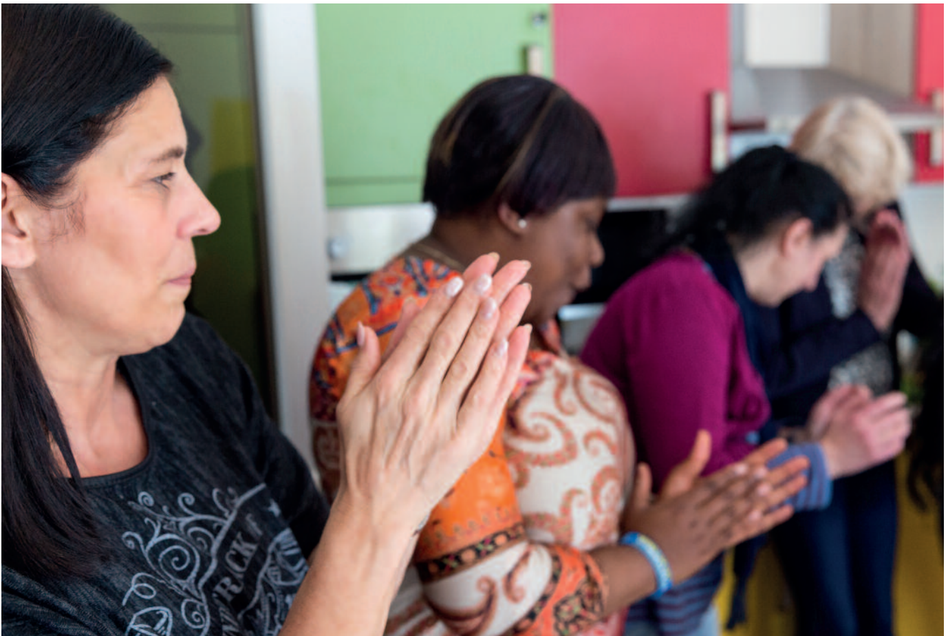
Kooperieren Kindertagespflege und Kitas auch auf Trägerebene, bieten sich Familien mehr Möglichkeiten, das passende Betreuungsangebot zu finden

In der außerfamiliären Betreuung ihres Kindes erwarten sie, dass sie als Experten ihres Kindes gesehen werden und ihr